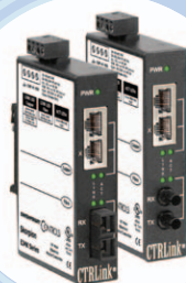
Convertidores de medios