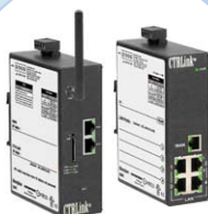
Routers IP o celulares