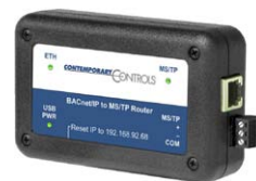
Router BAS portátil