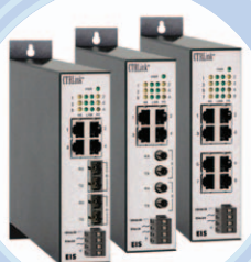
Switches aptos contra humo y fuegos

La red Ethernet se ha convertido rápidamente en la más utilizada en edificios inteligentes gracias a su alta velocidad, a su fácil conexión con Internet y a que ya es bien conocida entre los usuarios. Pero el entorno puede ser muy exigente. Por ello, los equipos deben ser robustos, fiables y de fácil instalación, mantenimiento y uso. Deben estar homologados según la reglamentación correspondiente y, en algunos casos, resistir temperaturas exteriores extremas. Un equipamiento normal de oficina, que saque frecuentemente nuevas versiones y con los habituales inconvenientes de montaje, no suele bastar.