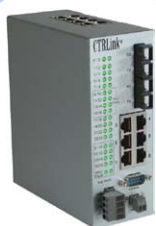
Switches de automatización